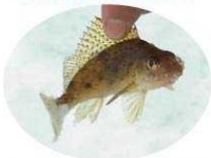
И, конечно, у ерша.