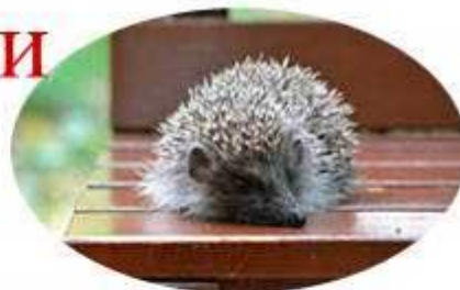
Есть иголки у ежа.