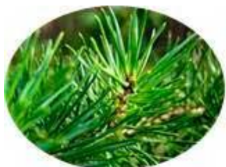
У сосны и ёлки Тоже есть иголки.